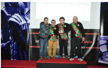
SC. ESTRELA DA POUSADINHA B